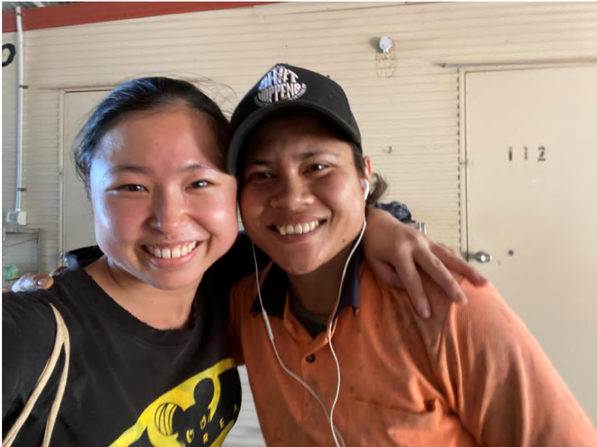
左が参加されたSさん