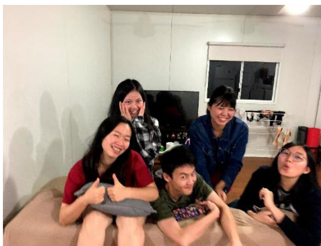
宿泊施設の仲間達