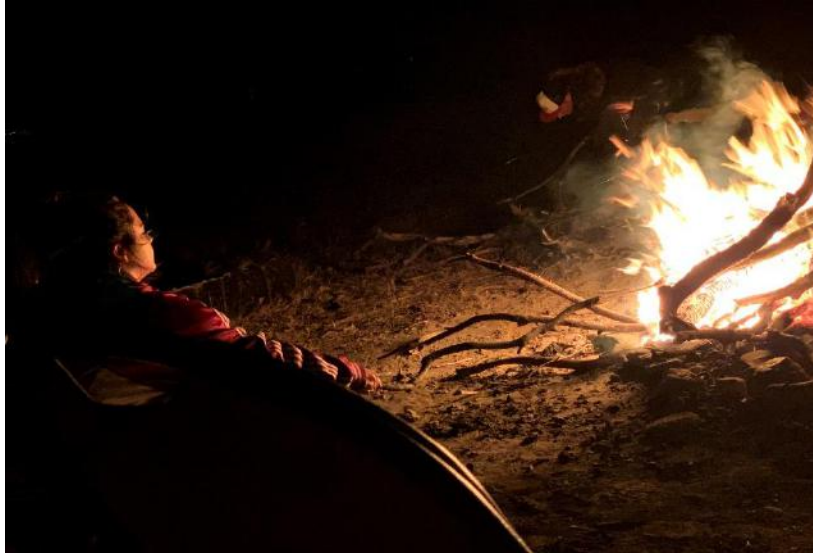
キャンプファイヤー