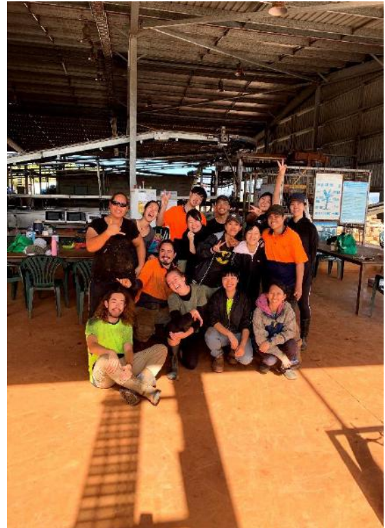
作業スタッフの仲間達

私は不安いっぱい始めたファームの仕事でしたが、濃密であつという間、楽しいことしかなかった3ヶ月でかけがえのない経験が出来ました。短期間（きっかり3ヶ月）で5000ドルほど貯金することが出来ました。私は他のファームへ行ったことはありませんが、他のファームで働いた友人の話聞く限り、このファームに勝るファームは無いです。