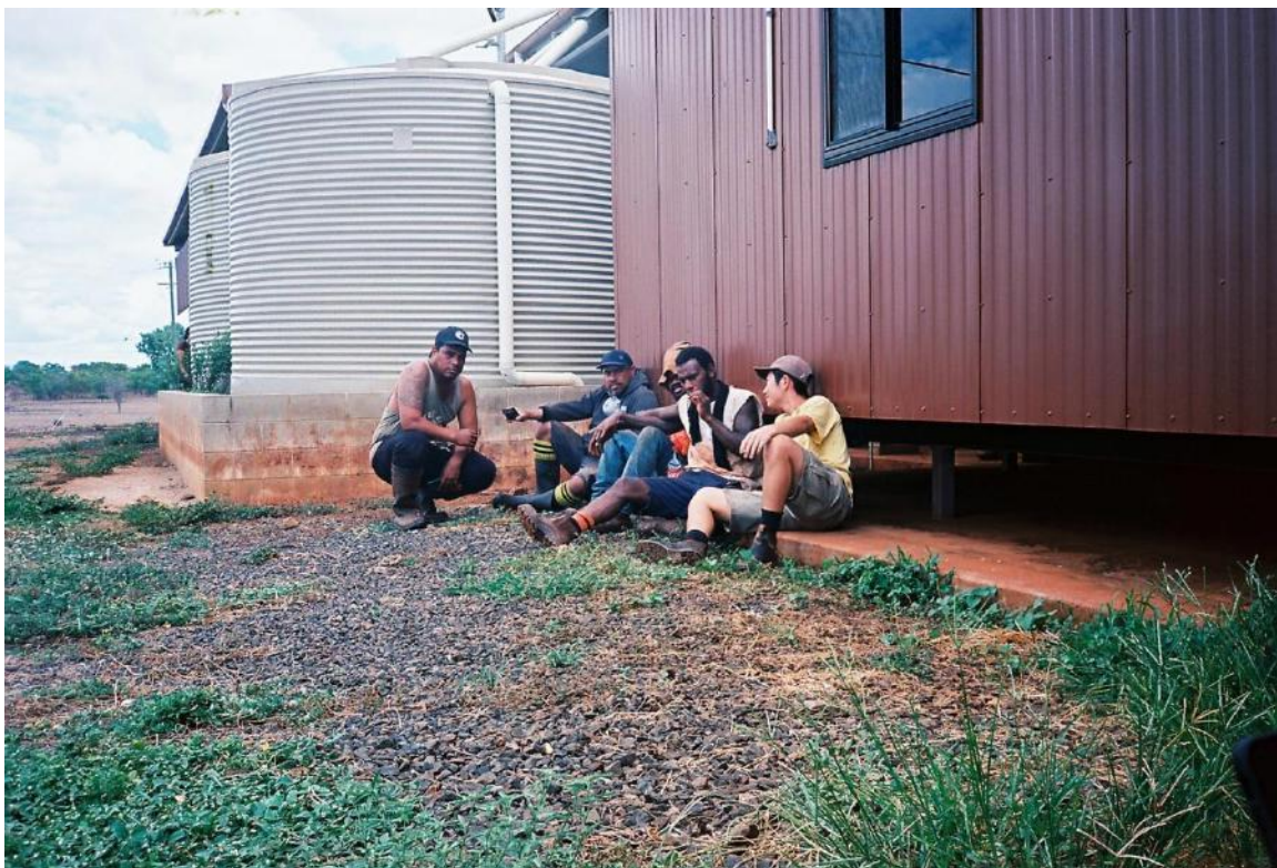
一番右端 参加されたOさん