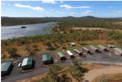
Kさんが滞在してた宿泊施設