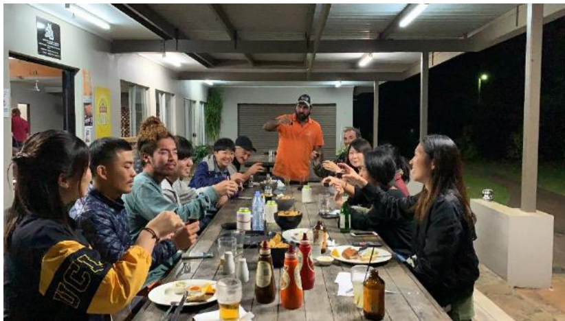
宿舎の仲間達との食事